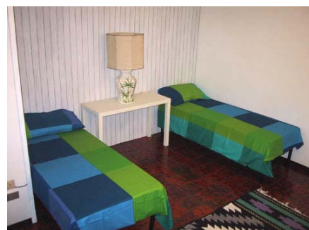
Camera a letti gemelli con televisione e bagno privato