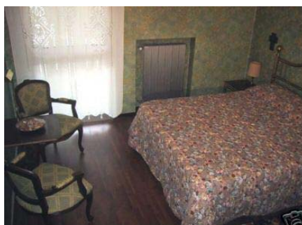
Camera da letto in stile classico con televisione e bagno privato