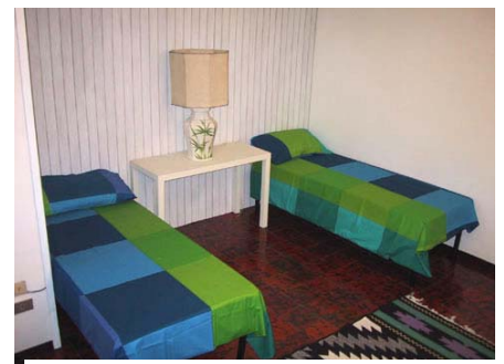
Zweibettzimmer mit Fernsehen und privat Bad.